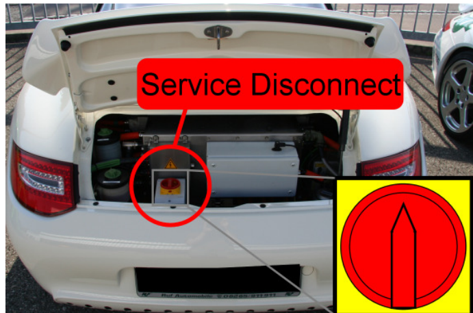
Bild zeigt den Service Disconnect bei aktiver Hochspannung.

Deaktivieren der HV-Anlage über den Service Disconnect im Motorraum.